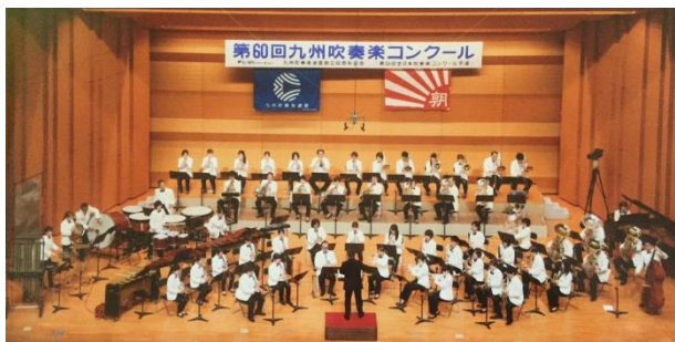
市民吹奏楽団大牟田奏友会