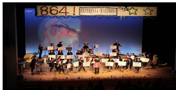
荒尾市民楽団 864 !